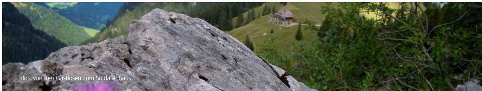
Blick von den Gastlosen zum Soldatenhaus

Beat Stingel Eigerstrasse 4 3076 Worb 031 839 04 05 079 208 09 13 beat.stingel@bluewin.ch