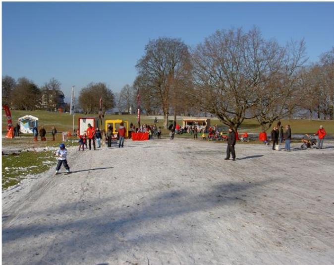
Gurtenmatte am 4. Februar 2007. Hier findet unser Fest am 16.2.2008 statt.

Die Berner Kantonalbank BEKB hat uns als Sponsor einen namhaften Betrag zur Durchführung dieses Gründungstages auf dem Gurten zugesichert. Wir danken für die grosszügige Unterstützung.